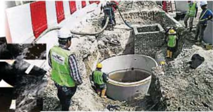
早前在灵市一带进行的巴生河流域排污系统升级工程为“生命之河”项目之一，并由联邦排污服务局进行化粪池整合计划，因为工作人员正在安装新的地下排污管。