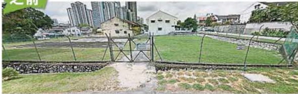
排污保留于2017年时空旷，但如今已成为一片丛林。