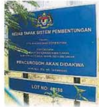
保留地上也没有告示牌，清楚显示该地段是联邦排污服务局所属。

Provided for client's internal research purposes only. May not be further copied, distributed, sold or published in any form without the prior consent of the copyright owner.