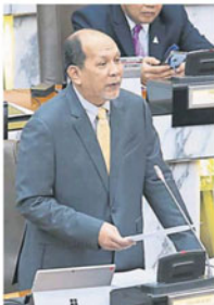
依占哈欣：西海岸农民确实面对收成下降问题。