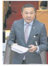
黃思漢：徵收泊車費是地方政府的權力。

可根據適當的土地，提供適當的公共泊車位給民眾。 “因此，地方政府有權力在已充報泊車區的地段上，徵收泊車費。” 黃思漢今日在雪州議會上，口頭回答峇達里區議員梁德志的提問時，這指出。 巴生市議會曾於2014年和2017年期間，兩度計劃把泊車收費版圖擴大至班科，惟最終因商民和當地州議員反對而無法成事，然而市議會死心不息，今年重新建議把班科列為泊車收費區。 班科過去5年來，兩度通過收泊車費的“劫數”，如今這項攤派多年的建議再度響起，班科區州議員梁德志便表達強烈反對立場。