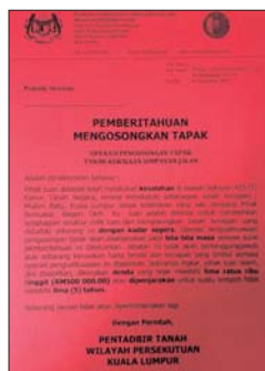
Notis kepada premis perniagaan haram oleh PTG Wilayah Persekutuan semalam.

"Nampaknya PTG bertindak proaktif selepas masalah tersebut dibangkitkan dalam akhbar teta-