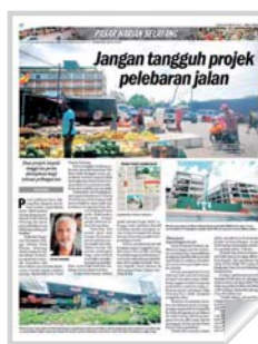
Laporan Sinar Harian kelmarin.