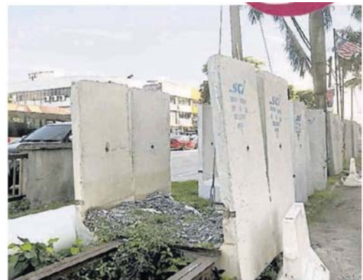
排水系統提升工程延期進行，U型溝放在路邊已一段時間。