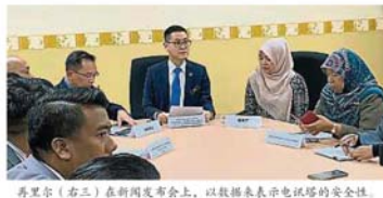
再里爾（右三）在新聞發布會上，以數據表示電訊塔的安全性。

再里爾在议会厅外召开新闻位，引述权威和官方单位的一些数据和说法，以讲述电讯塔的安全性。