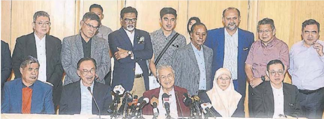
安华、旺阿兹莎及林冠英。 应记者提问，左起为莫哈末沙布、 马哈迪（前排中）在记者会上回