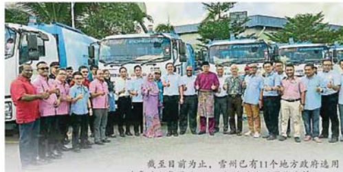
截至目前为止，雪州已有11个地方政府选用达鲁益山集团(KDEB)协助处理固体废物。