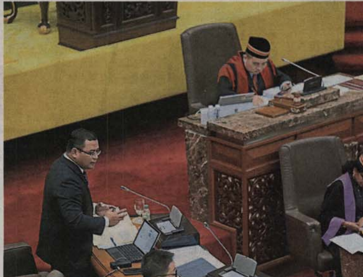
■雪州大臣阿米鲁丁(左)表示，雪州去年共吸引了多达189亿令吉，显示依然拥有强劲的吸资实力。右为议长黄瑞林。

(沙亚南5日讯)雪州大臣阿米鲁丁指出，尽管国际经贸市场存在不稳定或冲突因素，雪州依然保持强劲吸引力和竞争力，去年共吸引189亿令吉投资，其中外资108亿令吉、本地投资81亿令吉。